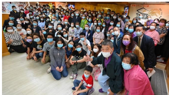
感恩崇拜後大合照